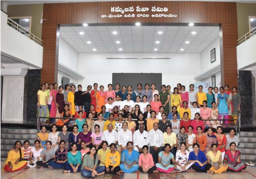
4వ సంవత్సరం పూర్తిచేసిన విద్యార్థులకు వీడ్కోలు సమావేశంలో విద్యార్థినులు, పాలకవర్గ సభ్యులు