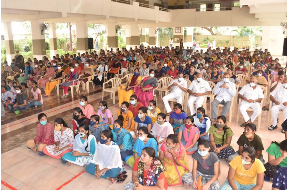
తానా తోడ్పాటు సభలో ల్యాప్ టాప్ పంపిణీ సందర్భంగా పాల్గొన్న పాలకవర్గ సభ్యులు మరియు విద్యార్థినులు