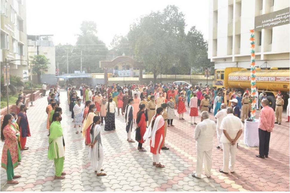
26-1-2022 గణతంత్ర దినోత్సవ వేడుకలలో పాల్గొన్న విద్యార్థినులు