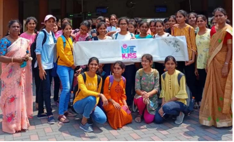
4వ సంవత్సరం బి. టెక్. చదువుచున్న విద్యార్థినులు 'వండర్లా' హైదరాబాద్ విహారయాత్రకు వెళ్ళిన సందర్భంగా...