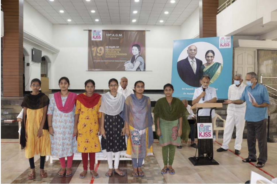
19వ సర్వసభ్య సమావేశంలో ఉపకారవేతనాల పంపిణీ