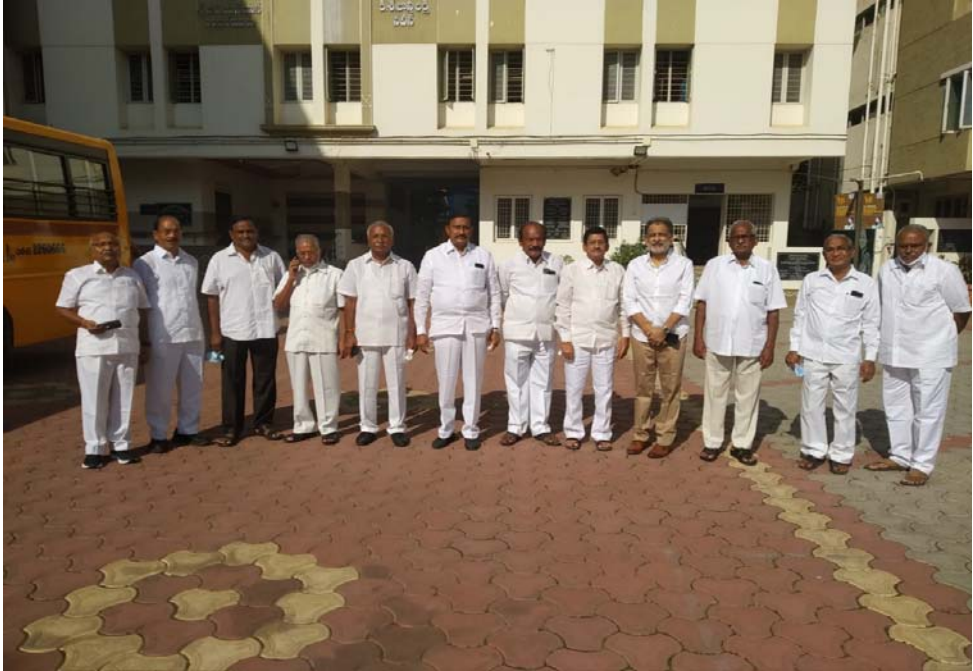
ఖమ్మం కమ్మ సంఘం వారు మన వసతి గృహాన్ని సందర్శించిన సందర్భంలో పాలకవర్గ సభ్యులతో గ్రూప్ ఫోటో