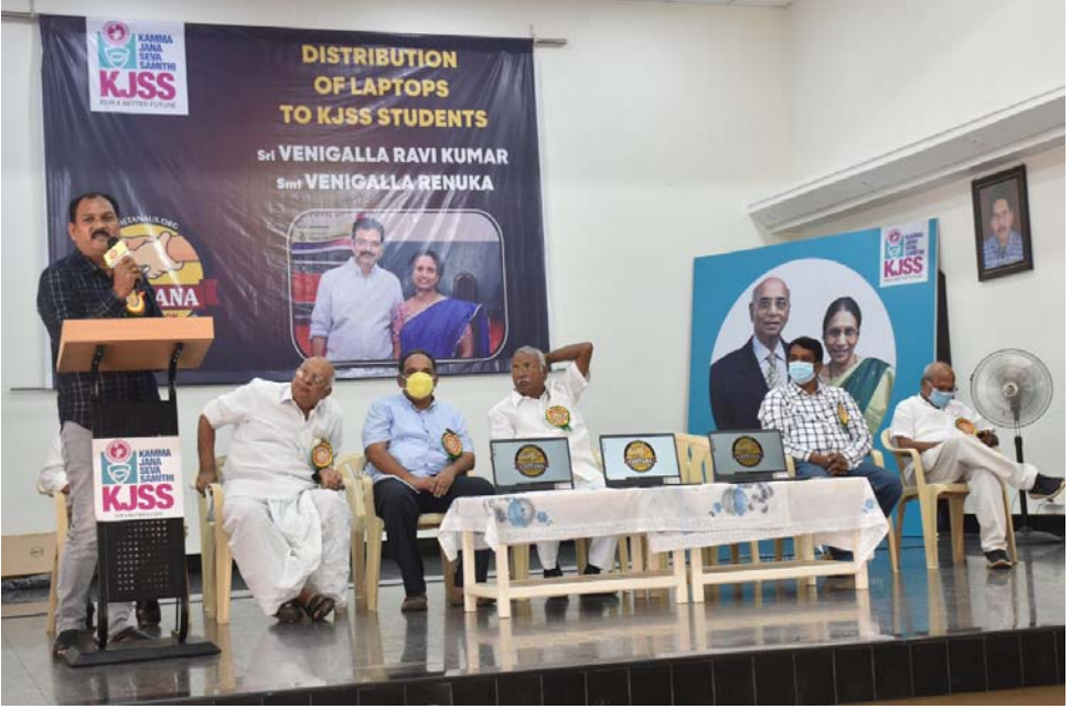
చేతన ఫౌండేషన్, యు.ఎస్.ఏ. విద్యార్థులకు ఆన్‌లైన్ క్లాసుల కొరకు బహుకరించిన ల్యాప్‌టాప్ పంపిణీ కార్యక్రమంలో అధ్యక్ష కార్యదర్శులు