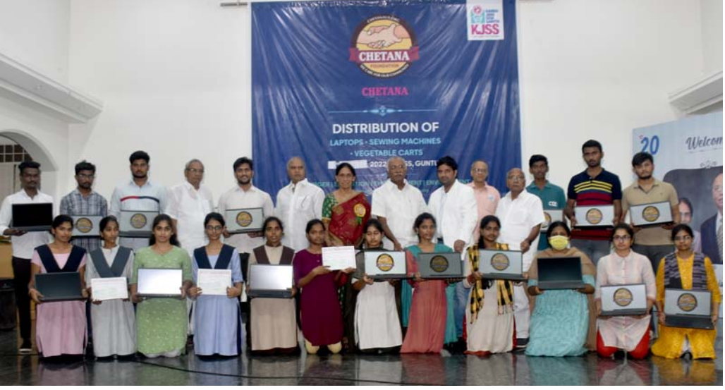
చేతన ఫౌండేషన్, యు.ఎన్.ఎ. వారు కోవిడ్ సమయంలో ఆన్‌లైన్ క్లాసుల కొరకు మెరిట్ మరియు పేద విద్యార్థినులకు బహుకరించిన ల్యాప్‌టాప్‌లు పొందిన విద్యార్థినులతో పాలకవర్గ సభ్యులు